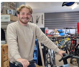
BEACH'BIKE Magasin de vélos Blainville sur mer