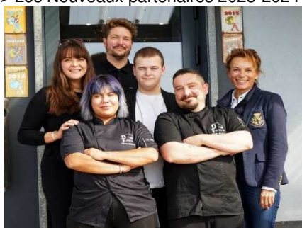
LA PLANCHA Bar – Tapas - Restaurant