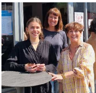
LES COUTAINVILLAISES Café - Hôtel