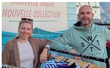
FORCE 7 'Beach shop' Vêtements, chaussures & accessoires