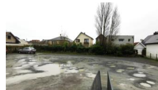
Parking en janvier 24

L'entrée au club pour les piétons, vélos et véhicules se fera exclusivement maintenant par l'avenue des Tennis.