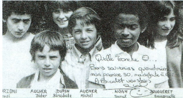
Une photo souvenir commentée par Yannick Noah lui-même.

Oui, le TC Coutainville est propriétaire de ses installations, notamment de notre superbe chalet, inauguré en 1920, qui sert de club-house. Il doit donc s'en occuper, mais nous vivons de nos propres ressources. Pourtant le club a été entièrement refait à neuf ces 10 dernières années, grâce au dévouement de nos bénévoles qui participent activement aux travaux (réfection des salons du club, de la salle du souvenir, cuisine rénovée l'hiver dernier) et à l'entretien de nos jardins – nous ne pouvons payer un jardinier à pleintemps. Certains de nos salons sont parfois loués pour des mariages ou des anniversaires, pour le reste nous vivons des cotisations de nos adhérents (180 euros l'année), et de l'aide de quelques entreprises locales. Nous avons vraiment une mission patrimoniale, car notre club est l'un des plus beaux de Normandie : nous possédons 5 courts extérieurs en GreenSet® qui ont été refaits il y a 4 ans, une