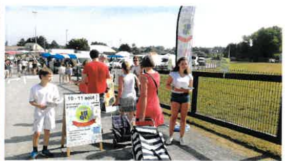
Communication au marché