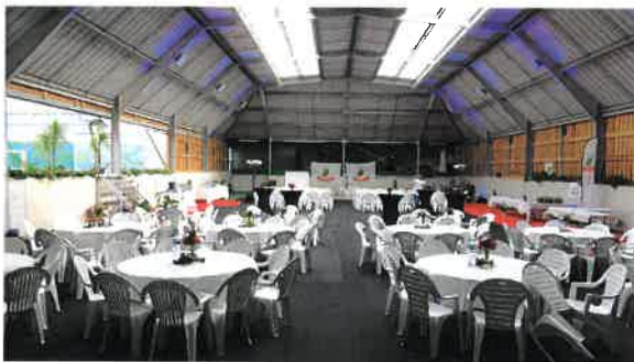
Soirée de gala