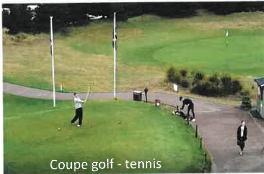
Coupe golf - tennis

Retour sur cette magnifique semaine d'animations et de fêtes.