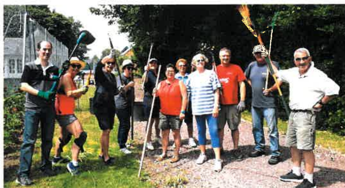
Journée jardinage en juin