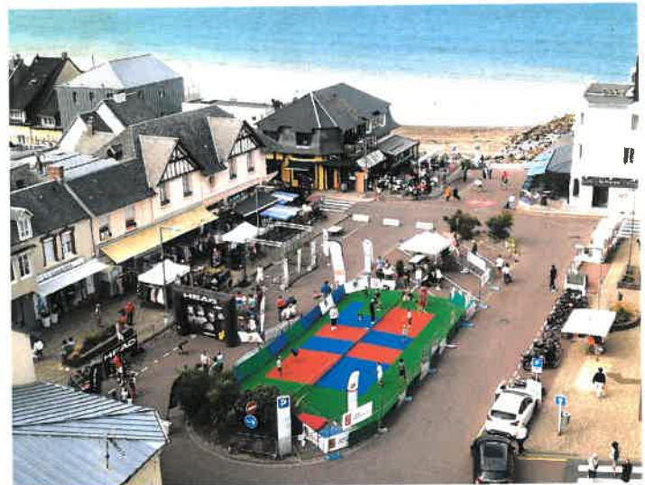
Centre ville : mini tennis et concours de vitesse de service