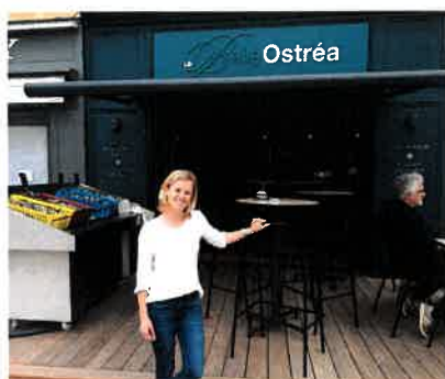
La Belle Ostréa