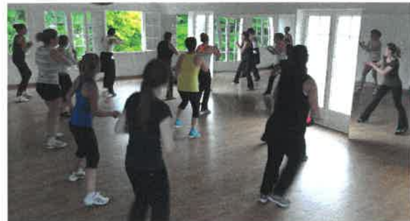
Cours de fitness

Pensez à vous inscrire pour la rentrée prochaine.