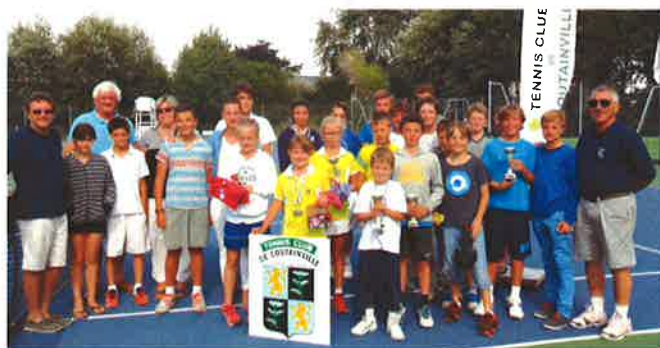
Tournoi des jeunes