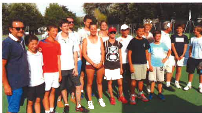
Coupe des familles