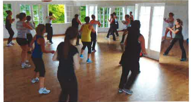
Cours de fitness