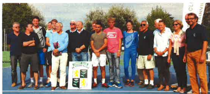
Tournoi séniors et vétérans