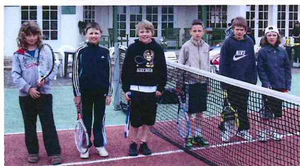
Equipe Garçons 11 - 12 ans TCC 2011